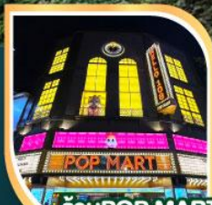
ร้านPOP MART ที่ใหญ่ที่สุดในไต้หวัน