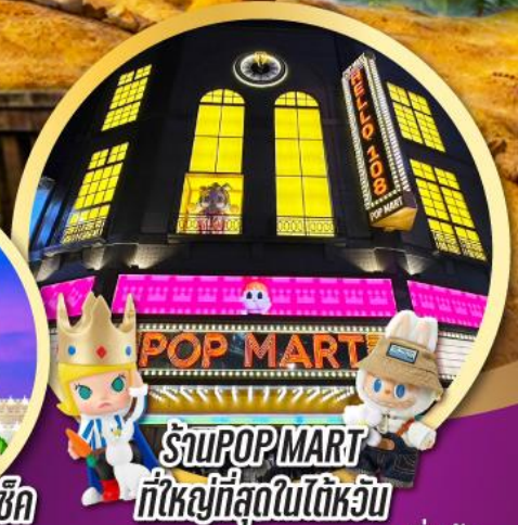
ร้าน POP MART ที่ใหญ่ที่สุดในไต้หวัน