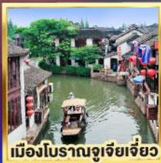
เมืองโบราณจู่เจียเจี๋ย