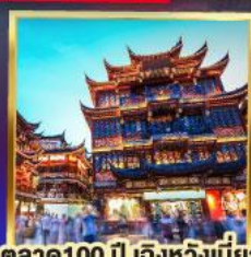
ตลาด 100 ปี เติ้งหวังเมี่ยว