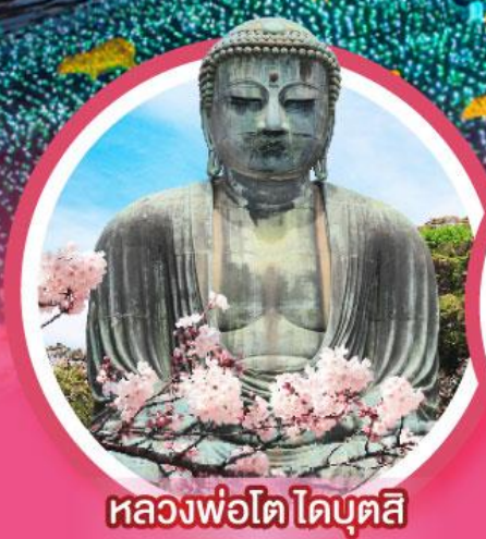
หลวงพ่อดโตโดบุตสึ