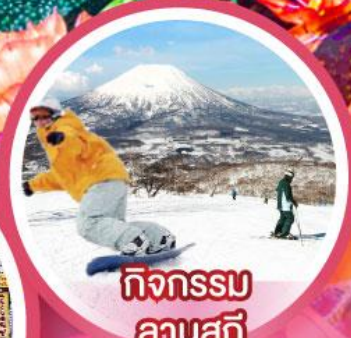
กิจกรรม ลานสกี

เดินทาง 18-23, 21-26 ก.พ. 68 14-19, 20-25 ก.พ. 68