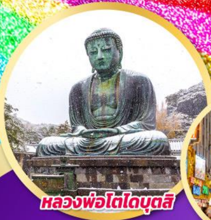
หลวงพ่อโตโตบุตสึ