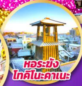
หอรบั้ง โทคิโนะคาเนะ