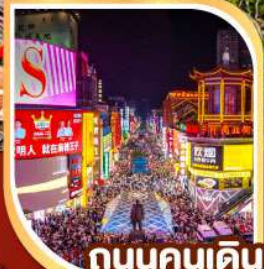
ถนนคนเดิน หวงซิงลู่