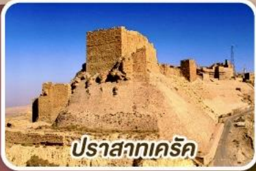
ปราสาทเคิร์ค