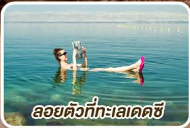
ลอยตัวที่ทะเลเดดซี