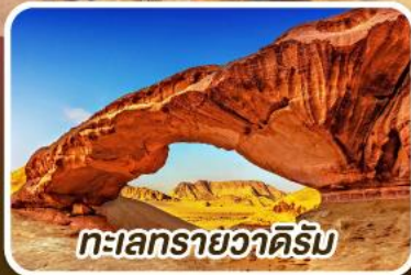
ทะเลทรายวาดีรัม