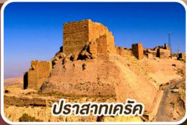
ปราสาทเคิร์ค