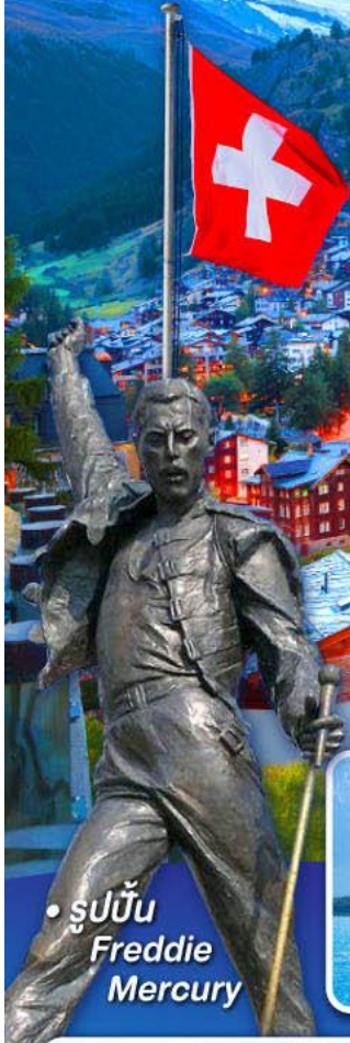
• รูปปั้น Freddie Mercury

พีชิต 5 เจริทิ, เชาฮาร์ดเคอร์คุม, เชาจุงเฟรา เชากลาซีร์ 3000 และ เชากรอนเนือร์แกรต