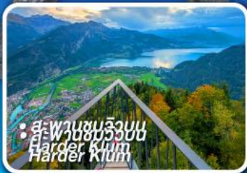
• สะพานชมริมน้ำ Harder Klamm