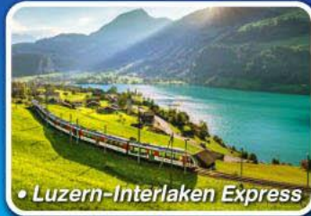
• Luzern-Interlaken Express