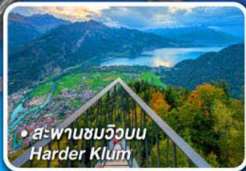
• สะพานชมวิวกบน Harder Klum