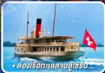
• สองเรือทะเลสาบลูซีร์น