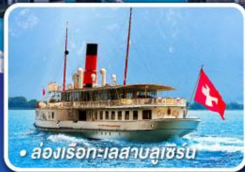
• ล่องเรือทะเลสาบลูซิร์น