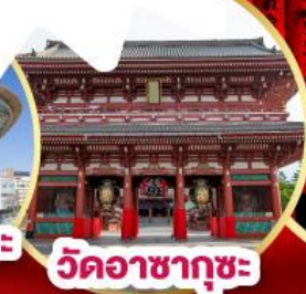
วัดอาซากุซะ