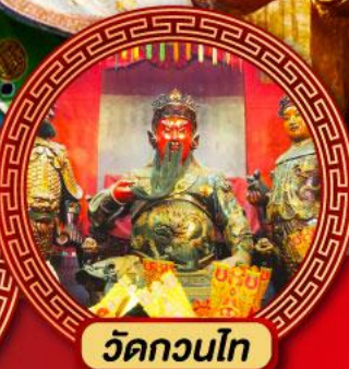
วัดกวนไท