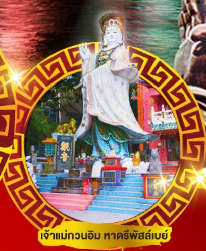
เจ้าแม่กวนอิม ทาคีพีส์เบย์

เมนูสุด พิเศษ!! ต้มข้าวฮ่องกง บุฟเฟ่ต์ชาบูสโตร์ฮ่องกง, ห่านย่าง